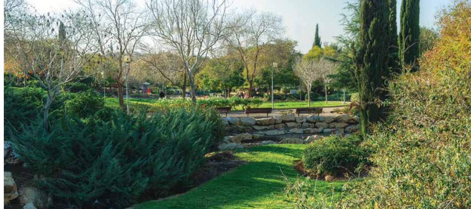
Ein Park in der Innenstadt von Ariel.

Der lange gehegte Traum, ein Zentrum für darstellende Künste in Ariel zu errichten, wurde im Jahr 2000 zur Notwendigkeit, als man aufgrund gewaltsamer Übergriffe von Arabern auf den Straßen überall in Samaria jedesmal sein Leben riskieren musste, wenn man anderswo eine kulturelle Veranstaltung besuchen wollte. Heute ermöglicht das hochmoderne regionale Zentrum für darstellende Künste den Einwohnern Ariels und der umliegenden Gemeinden bequemen Zugang zu dem Besten, was Israel im Bereich des Theaters, der Musik, des Tanzes und der bildenden Künste zu bieten hat. Es ist