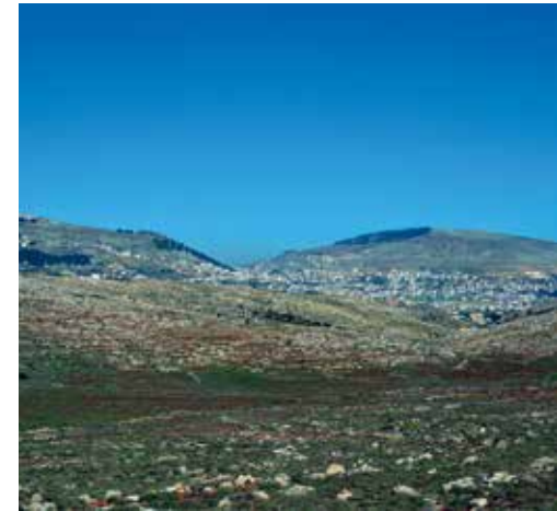
Berg Ebal und Berg Garizim.