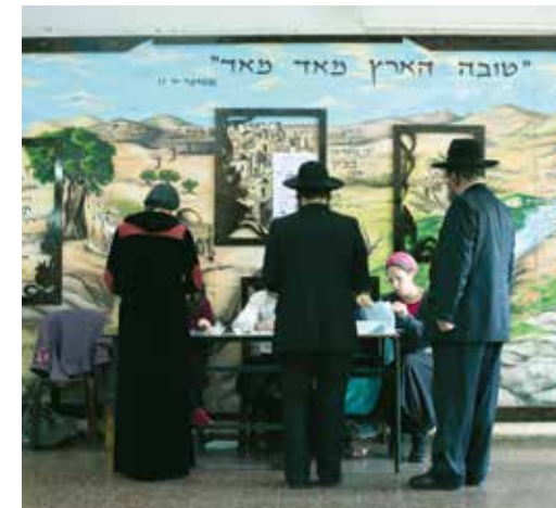
Ultraorthodoxe Juden in einem Wahllokal in Bnei Brak.

Drittens genießt Amerika in Israel zwar ein so hohes Ansehen wie kein zweites Land, das Wahlergebnis enthielt aber trotzdem eine unmissverständliche Botschaft an das Weiße Haus. Es ist ein offenes Geheimnis, dass die Obama-