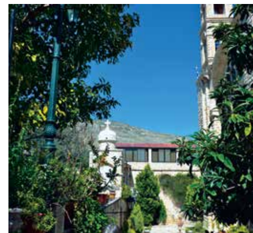
Blick vom Jakobsbrunnen auf den Berg Garizim.