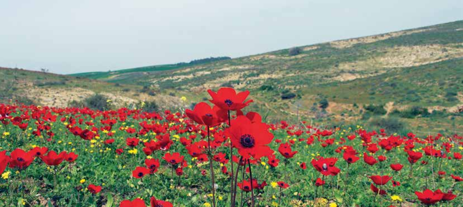
Rote Anemonen.