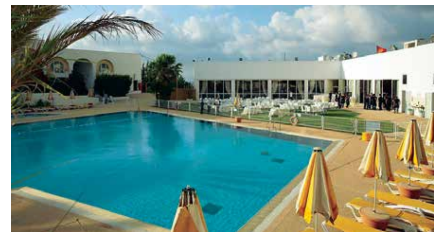
Der Swimmingpool des Hotels Eshel HaShomron. Nur wenige Schritte entfernt ist ein biblischer Garten, der Sie 3000 Jahre in die Vergangenheit versetzt.