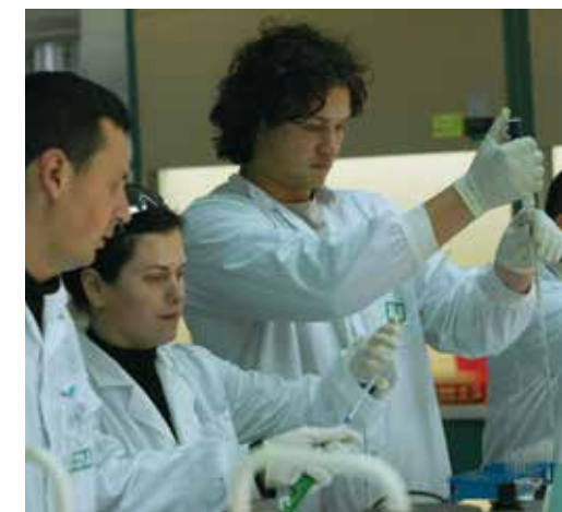
Studenten im Labor an der Universität von Ariel.