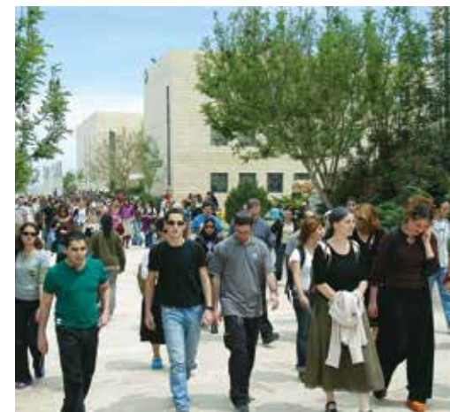
Studenten auf dem Weg zu ihren Lehrveranstaltungen an der Universität von Ariel.