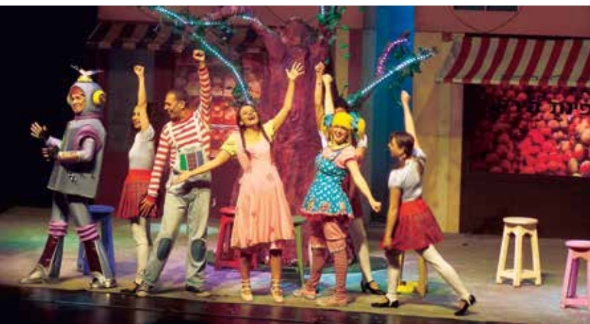
Aufführung des Zauberers von Oz im Zentrum für darstellende Künste.

Doch während der arabischen Angriffe im Jahr 2000 nutzten Terroristen den Hügel, um Ariel zu beschießen. Deshalb wurde zum Schutz und zur Verteidigung der Umgebung von Ariel und anderer jüdischer Gemeinden in der Region der Außenposten errichtet. Heute gibt es noch eine kleine Einheit der IDF auf dem Antennenhügel.