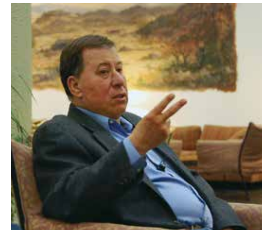
Ron Nachman.

Heute verdunkelt zudem eine alarmierende Abwendung von Israel in der amerikanischen Regierung den Blick in die Zukunft. Anstatt seinen einzigen zuverlässigen Verbündeten im Nahen Osten zu unterstützen, gibt Amerika den Vereinten Nationen