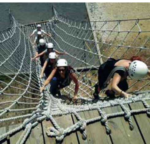
Klettern auf der Strickleiter im Nationalem Zentrum zur Förderung von Führungsqualitäten in Ariel.