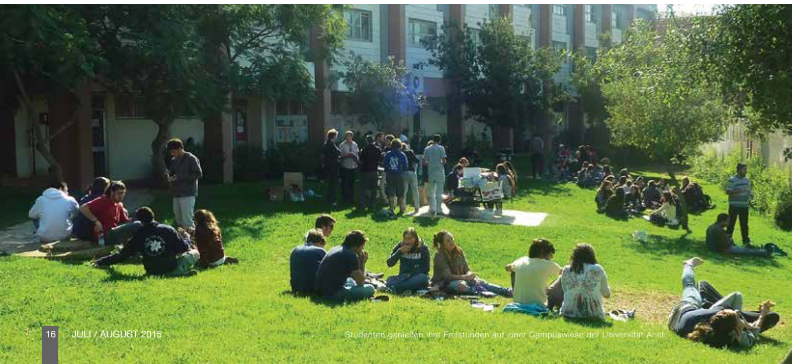
Studenten genießen ihre Freistunden auf einer Campuswiese der Universität Ariel.

Durch die dort ansässigen Bildungseinrichtungen und Industrie ermöglicht Ariel, die Hauptstadt von Samaria, es den Menschen in der Region, Frieden durch zwischenmenschliche Beziehungen und gemeinsame Ziele zu schaffen.