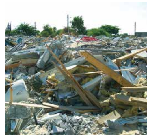
Die Überreste von Oreet Segals Haus in Gush Katif nach der Übernahme durch die Araber.