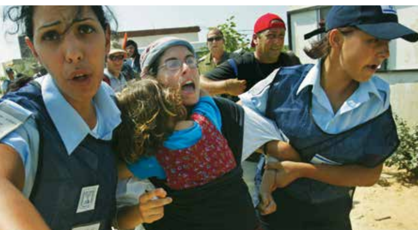
Sicherheitskräfte entfernen am 17. August 2005 gewaltsam Einwohner aus Kerem Atzmona im Gazastreifen.