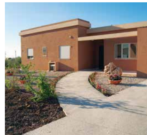
Endlich! Das neue Zuhause der Segals in Ganei Tal.