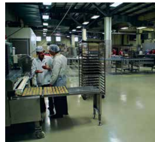
Eine Keksfabrik im Industriegebiet.

Oben auf einem Hügel oberhalb des Zentrums zur Förderung von Führungsqualitäten ist die Antenne, von der der Antennenhügel seinen Namen hat, ebenso wie der Bunker, an dem man erkennen kann, dass sich dort ein Standort der israelischen Verteidigungskräfte (IDF) befindet. Viele Jahre lang gab es hier keine Soldaten.