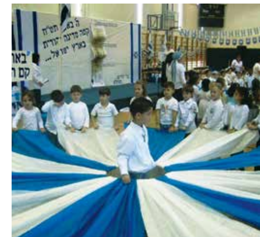
Kinder lernen, das Land Israel zu feiern.

Ariel ist das regionale Zentrum für 20 000 Einwohner, 15 000 Universitätsstudenten und Zehntausende mehr, die in benachbarten Gemeinden leben. Doch das nächste Krankenhaus liegt 30 Minuten entfernt. Daher gibt es Pläne, ein medizinisches Zentrum auf dem Campus der Universität von Ariel zu errichten, das jedem in der Region, ob jüdisch oder muslimisch, zugute kommt. Gegenwärtig bietet die Universität medizinische Dienstleistungen an. Das medizinische Zentrum wird Einrichtungen für Notfallmedizin und Rehabilitation, Ergotherapie und psychologische Beratung besitzen. Es wird Teil des medizinischen Dreifachkomplexes werden, zu dem auch eine Ausbildungsstätte, die auf das Medizinstudium vorbereitet, sowie ein gesundheitswissenschaftliches Zentrum mit Klinik gehören werden. All das begann mit zwei Zelten, die vor weniger als 40 Jahren aus Helikoptern auf einen unfruchtbaren, felsigen Hügel abgeworfen wurden.