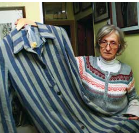
Eine Häftlingsjacke aus einem Vernichtungslager, heute Ausstellungsstück im Holocaust-Museum von Ariel.