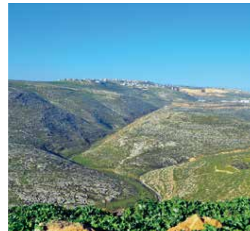
Der Pass, an dem Jonathan die Philister besiegte.

Silo ist ein schönes Fleckchen Erde, aber seine Ruinen sind eine mahnende Erinnerung an die Gefahren, die aus dem Ungehorsam gegenüber Gott ent-